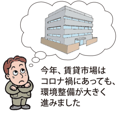
今年、賃貸市場はコロナ禍にあっても、環境整備が大きく進みました

4月1日に「民法の一部を改正する法律」が施行され、成年年齢が20歳から18歳に引き下げられました。賃貸借契約にも影響して、18歳であれば賃貸借契約に親権者同意書が不要となりました。