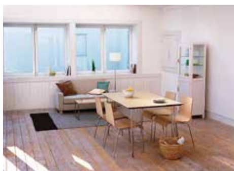
差別化を進めた意外性のある賃貸住宅・新ビジネスが相次いでいます

新幹線を利用した長距離通勤は知られていますが、飛行機を利用した日々の通勤はあまり見られません。しかも家賃をセットにして、全体の収支のバランスを図る新ビジネスが相次いでいます 新幹線を利用した長距離通勤は知られていますが、飛行機を利用した日々の通勤はあまり見られません。しかも家賃をセットにして、全体の収支のバランスを図る新ビジネスが相次いでいます 新幹線を利用した長距離通勤は知られていますが、飛行機を利用した日々の通勤はあまり見られません。しかも家賃をセットにして、全体の収支のバランスを図る新ビジネスが相次いでいます