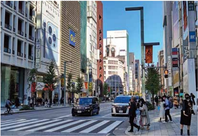
安定成長の中、多様性が一気に進んだ賃貸住宅市場ですが、今年から来年にかけて多くの課題が積み残されて、年を越えようとしています

あなたの資産を生かす(土地から建物まで) (社)全国宅地建物取引業保証協会会員 (社)岩手県宅地建物取引業協会会員 =アパート・貸家・土地・建物仲介= 有限会社 東西不動産ホーム E-mail : touzai2103@goo.jp ホームページアドレス http://www.touzai2103.co.jp/ スタッフブログ http://touzai2103.blog74.fc2.com/