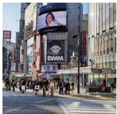
マーケットも「with コロナ市況」に反応して、微妙な変化が見られます

「騒音等のクレームの増加」や「クレーム・収入減による退去」 「騒音等のクレームの増加」や「クレーム・収入減による退去」 「騒音等のクレームの増加」や「クレーム・収入減による退去」