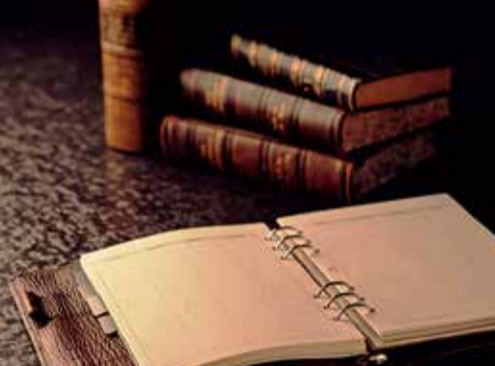
課税事業者のオーナー様は、取引先の法人様からインボイスの提出を求められることが十分考えられます。また、免税事業者といつても影響が皆無という訳ではありません。なお、インボイス制度が始まるに当たり、小規模事業者を対象に、負担軽減策を認める特例措置を検討している、との報道もあります。本

住宅用の家賃は非課税ですから住宅用アパート・マンションを経営するオーナー様は消費税を扱っておらず、免税事業者である場合が多く、影響が少ない半面、