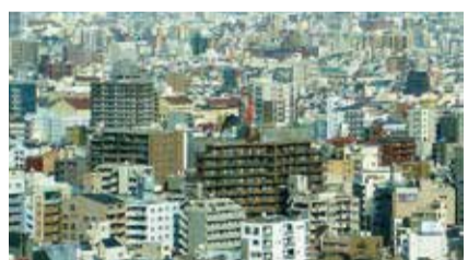
不動産市場価格の動向を表すものとして、全国・地域別、住宅・商業用別の市場分析を通じ、投資環境の整備などが進むことを目的として作成されているものです。

資材価格の高騰に伴う建設コストの増加から、賃貸住宅新設の投資を見極めようとする動きが見られるだけに、今後も市中で取引されるマンション・アパート価格の上昇基調は続く見込みです。