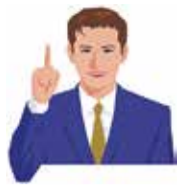
「インボイス制度とは、売手

るものです。具体的には、現行の区分記載請求書に登録番号、適用税率、消費税額等の記載が追加された書類やデータを指します(国税庁)。