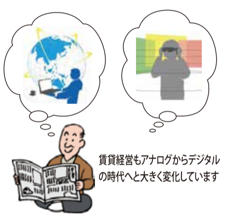
賃貸経営もアナログからデジタルの時代へと大きく変化しています

「賃貸住宅標準契約書」「定期賃貸住宅標準契約書」「サブリース住宅標準契約書」についても、宅地建物取引士の押印欄が