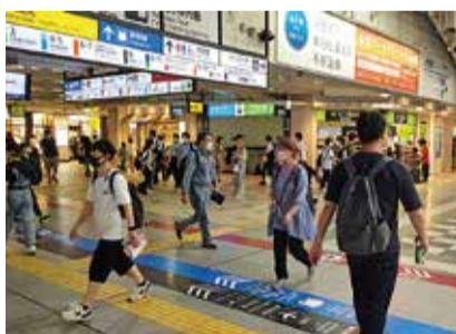
「出社しなくてもいい」テレワークが、今後の賃貸市場にどのような影響を及ぼすか注目されます