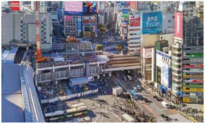
コロナ禍は賃貸ビジネスのデジタル化の促進に、大きく影響しました

コロナ禍を機に、社会全体のデジタル化に拍車がかかっています。賃貸住宅市場においてもデジタル化がここ一年で加速しました。新年を迎え、変革の歩みに弾みがついてきました。