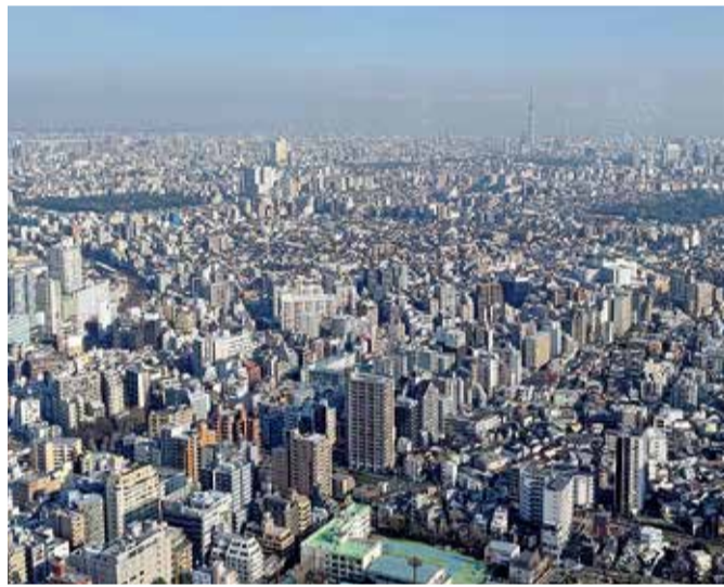
賃貸住宅市場は時代のニーズに応じて、国は法律面で環境を整え、我々もサービスの充実を図っていきます

「ク、在宅勤務向け物件」の整備が進められ、一つのマーケットを構成するに至っています。 転入者数の増加 活発化する人口移動