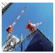
低金利の継続に加えて、人口減少に對して世帯数が伸びてきた

ンポの実績を見せています。今日、新築、建て替えが活発なのは、根強い賃貸経営への投資意欲を支える