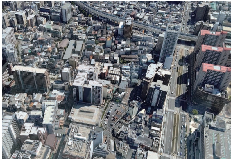
景気は改善しつつ上向きに転じる一方、資材価格の高騰などの不安要因も見逃せません。気になるのは、今後の「低金利政策」の行方です

あなたの資産を生かす(土地から建物まで) (社)全国宅地建物取引業保証協会会員 (社)岩手県宅地建物取引業協会会員 =アパート・貸家・土地・建物仲介= 有限会社 東西不動産ホーム E-mail : touzai2103@goo.jp ホームページアドレス http://www.touzai2103.co.jp/ スタッフブログ http://touzai2103.blog74.fc2.com/