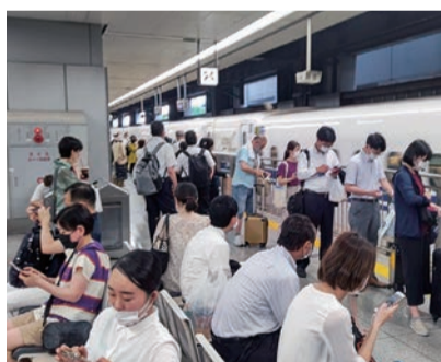
人の動きも増え、市場の活気ある部屋探しの動きに期待しています

上昇傾向を見せる一方、マイナス面も募集家賃に地域差が微妙に反映される 賃貸マンション・アパートの家賃の動向が不動産情報サービス会社等から発表されています。直近1ヵ月に発表されたデータを取り上げてみたいと思います。 それぞれ発表されるデータは、集計時期が現況とズレ込んでいますが、あくまでも家賃の平均的な傾向として見てください。 不動産情報サービスのアットホーム(株)の全国主要都市「賃貸マンション・アパート」募集家賃動向(7月)によると、マンションの平均募集家賃は、東京都下・埼玉県・千葉県・大阪市の4エリアが3ヵ月連続、全面積帯で前年同月上回りました。カッパル向きマンションが、全10エリアで前年同月上回り、東京都下・埼玉県・千葉県の3エリアで、2015年1月以降、最高値を更新しました。 アパートは、カップル・ファミリー向きが札幌市を除く9エリアで前年同月上回り、中でも東京都下は2タイプとも2015年1月以降、最高値を更新。東京23区ではファミリー向きは4ヵ月ぶりに上昇しました。 首都圏の掲載平均賃料 都心で前年を下回る また(株)LIFULLが9月6日に発表した「LIFULL HOME・S マーケットレポート2022年4~6月期」によると、4~6月期の主なトピックスとして、「首都圏では掲載平均賃料が前期(1~3月)比で上昇傾向だが、都心では依然前年を下回る傾向に。首都圏の平均専有面積が掲載・反響物件ともに拡大に向かう一方、近畿圏では引き続き縮小」と、捉えています。 一方、全宅連不動産総合研究所が発表した7月実施の「第26回不動産市況DI調査」結果によると、全国の「居住用賃貸の賃料がマイナス4.7ポイント、事業用賃貸ではマイナス8.7ポイントとなり、前回調査同様、居住用、事業用ともにマイナスが続いている」という結果になりました。