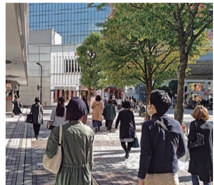
景気の「持ち直し・足踏み」が賃貸需要にどのように影響するか、市場の動きに目が離せません

の全国的商業用不動産総合では、店舗が前期比1.9%減少し、オフィスが0.4%増え、マンション・アパート(二棟)が2.4%増となりました。また、国土交通省から公表された今年前半(4月1日~7月1日)の全国主要都市の地価動向を調査した「地価LOOKレポート」によると、主要都市の地価は商業地で上昇しています。 「マンション市場の堅調さから住宅地価は上昇を維持」 こうした傾向の主な要因として、「住宅地ではマンション市場の堅調さが際立ったことから引き続き上昇を維持し、商業地では主に地方圏において新型コロナウイルス感染症の影響等により下落している地区が残るものの、経済活動正常化への期待感や低金利環境の継続等による好調な投資需要等から多くの地区で上昇、横ばいに移行した」と説明しています。 一方、足元の賃料の傾向では、「マンションの平均募集家賃は、東京都下・埼玉県・千葉県・大阪市の4エリアが3ヵ月連続で全面積帯で前年同月上回りました」(アットホーム、1面「賃貸マーケット情報」参照)。 以上の通り、ここ1ヵ月に公表された不動産関連のデータを紹介します。ややマクロ的な動向ですが、不動産・賃貸市場の概況を示しています。今後ともこうした経済指標を注視したいと思います。