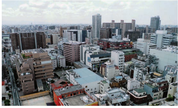
「過去の人の死」に対処して、明文化されたことで、円滑に進んでいます

国土交通省から「宅地建物取引業者による人の死の告知に関するガイドライン」が公表されて1年が経ちます。深刻な話も聞かれる中で、ガイドラインの整備で変化が見られるようになってきました。