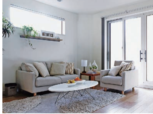
入居者の人気が高いこともあって、築浅の存在感が増し、市場での競争は新築がどうしても有利になります。

賃貸市場では築7年ものが4割強を占め、全体の半分強が新築～築17年の物件で構成されている通り、