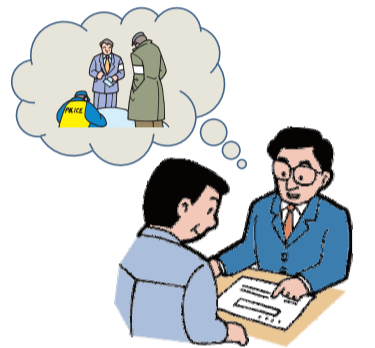
ガイドラインが策定され、告知の判断基準が明確になりました

告知については、原則として、人の死に関する事案が、取引の相手方等の判断に重要な影響を