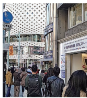
新型コロナウイルス感染症の脅威はあるものの、人々の往来は大きく落ち込んでいないようです

「景気ウォッチャー調査(内閣府)12月は4カ月連続の上昇」 景気の指標となっている内閣府が公表する令和3年12月の景気ウォッチャー調査は、景気の現状判断DIが56・4ポイントと、4カ月連続の上昇となっています。また、「景気は新型コロナウイルス感染症の影響は残るものの、持ち直している。先行きについては、持ち直しが続く」とみているものの、コスト上昇等や変異株をはじめ内外の感染症の動向に対する懸念がみられる」としています。なお、2〜3カ月前の景気の見直しに対する判断DIは、前月を4・0ポイント下回る49・4とまとめています。