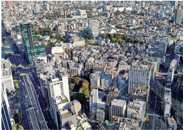
お客様との窓口業務は、非接触・非対面型サービスに比重がかかっていますが、従来通り直接ご来店いただくケースも少なくありません

あなたの資産を生かす(土地から建物まで) (社)全国宅地建物取引業保証協会会員 (社)岩手県宅地建物取引業協会会員 =アパート・貸家・土地・建物仲介= 有限会社 東西不動産ホーム E-mail : touzai2103@goo.jp ホームページアドレス http://www.touzai2103.co.jp/ スタッフブログ http://touzai2103.blog74.fc2.com/