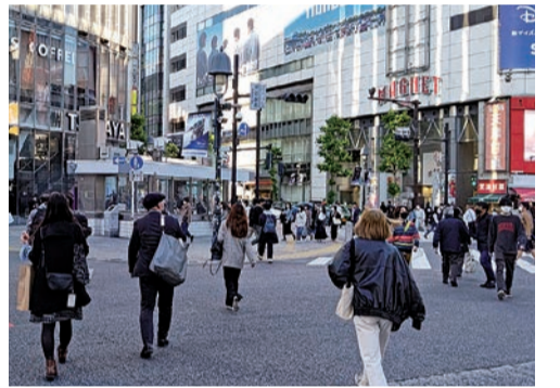
4月1日以降の契約には、契約開始時の満18歳の確認が必要となってきます

成年年齢の改正に対して政府は、「成年年齢を18歳に引き下げることには18歳、19歳の若者の自己決定権を尊重するものであり、その積極的な社会参加を促すことになると考えられる」と、説明しています。