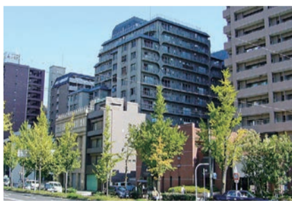
物件選びで重視されるポイントを活用して、契約の促進を図りたいものです

データを男女別に見ると、女性は男性に比べ、全ての項目において重視するポイントが高いという傾向で、とくに上位3項目に加え、「築年数」