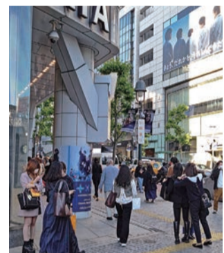
コロナ禍の影響で、経済的な意識が高まっています

また、住まいの設備で導入を検討、実施したものは、「インターネット(Wi-Fi)環境」が最も多く、性別、年代、地域の全てにおいて最多となっています。「空気清浄機」「エアコン」などの空調「換気設備」などへの関心も、昨年度同様に高い傾向にあります。