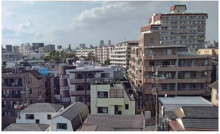
生活便のよさと環境のよさは、どちらも根強い賃貸ニーズです