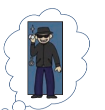
女性のセキュリティへの関心は年々高まっています

「通学先・通勤先の近くに引越したい」、3位は「ペット可物件に引越したい」となっています