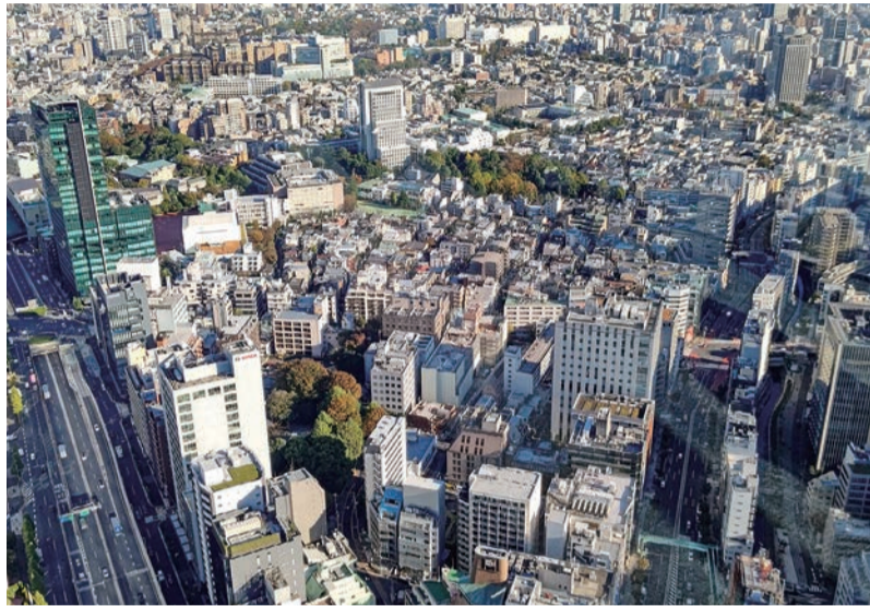
多くの人の生活ベースとなるのが住宅です。その中において、賃貸住宅を選択する「意識」は、時代の変動とともに変化を見せています

重視する点は、やはり「家賃」が最も多く、昨年度よりも増加しており、経済的意識が高まったことが読み取れます。次いで、「交通の利便性」が良い「周辺・生活環境が良い」と続き、間取りや日当たりなどの物件情報よりも、住環境が重視されているようです。若い年代ほど商業施設など周辺・生活環境を重視し、60代以上は日当たりを重視している結果は、