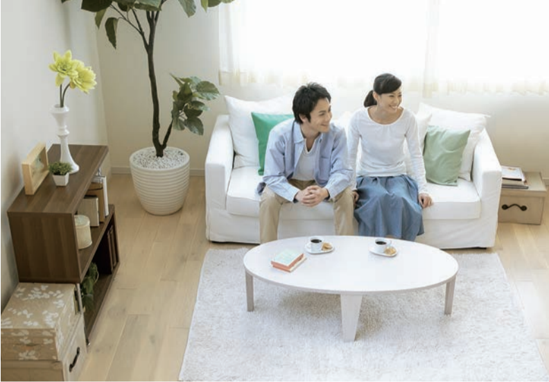
時代とともに常に変化を見せる入居者ニーズ。しかし、安定した成長が続く賃貸市場を反映して、基本的には大きな変化が見られません

あなたの資産を生かす(土地から建物まで) (社)全国宅地建物取引業保証協会会員 (社)岩手県宅地建物取引業協会会員 =アパート・貸家・土地・建物仲介= 有限会社 東西不動産ホーム E-mail : touzai2103@goo.jp ホームページアドレス http://www.touzai2103.co.jp/ スタッフブログ http://touzai2103.blog74.fc2.com/