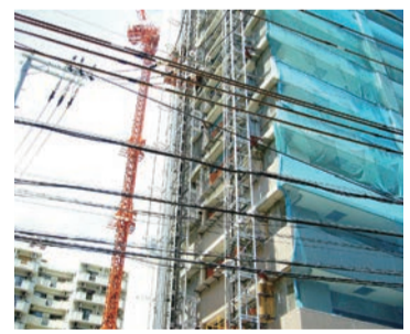
市場の投資意欲に支えられて、全国的にも賃貸住宅の新設が相次いでいます

景気が少しづつながら上向いているようです。今後、人の動きが活発化すれば回復基調のスピードアップが期待されます。 景気は持ち直し、改善の方向 コスト上昇等に対する懸念 内閣府が5月12日に公表した4月の「景気ウォッチャー調査」結果によると、「景気は持ち直しの動きがみられる。先行きについては、ウクライナ情勢による影響も含め、コスト上昇等に対する懸念がみられる」とまとめています。 「TDB景気動向調査(全国)」(帝国データバンク)の4月調査の結果によると、「4月の景気DIは前月比0.4ポイント増の40.8となり、2カ月連続で改善した。不動産DIは前月比0.4ポイント増の43.2と、2カ月連続で改善している」としています。