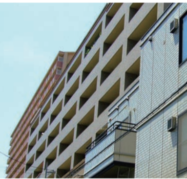
賃貸住宅の選択理由は、やはり家賃、立地・環境、部屋の広さ・設備が第一のようです

また、賃貸住宅入居世帯の物件に関する情報収集の方法として、次いでインターネット、知人の紹介となっていました。令和3年度の調査ではコロナ禍が影響して、インターネットがわずかながら増加しました。